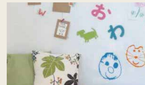
マグネット式壁面ボード