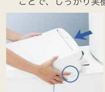
ワンタッチで外れる便座