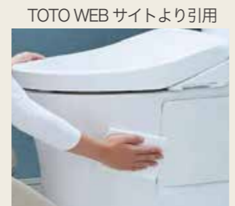
側面蓋がついて掃除しやすい

きっかけはシャワー便座が壊れていたことでした。いくつかメーカーショールームを見ていただきましたが、メーカー選定の決め手は実はシンプル。マンションには時々ある壁抜き排水方式で高さ制約があり、後継機種への継続性が決め手になりました。技術的観点で決まることもあるのです。とはいえ、日々使って汚れやすいところ。同じメーカーでもお掃除しやすいに越したことはないということで、しっかり実機を見て選定いただきました。