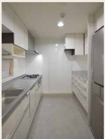
After: 収納しやすいII型キッチン