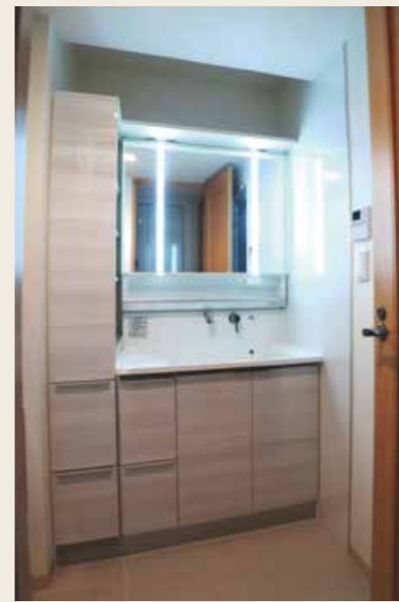
After: 収納もたっぷりですっきり