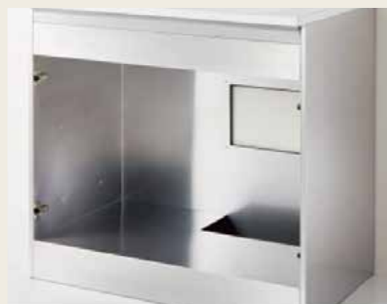
本体がステンレス製。カビ・サビ・臭いをカット。

せっかくのリフォーム洗面化粧台の交換だけではもったいないので壁にピタピタとマグネット収納をつけられるマグピタボードを設置しました。さらに化粧台本体の上の空きスペースがもったいないということで棚板も設置して収納たっぷりの洗面脱衣室に生まれ変わりました。