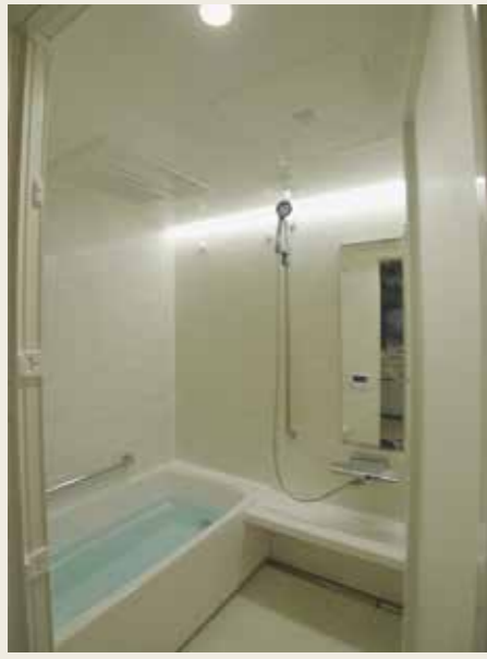
Before: 気になる足元の排水口