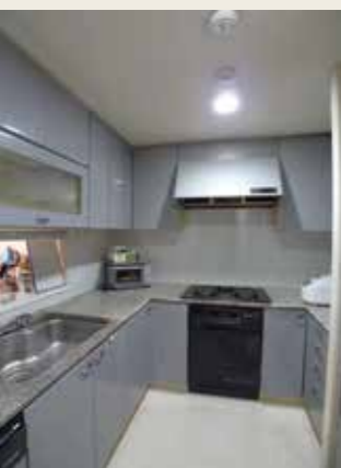
Before: L型キッチンはコーナーがデッドスペースになる。