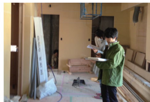
ゴーイング・グリーンのリフォーム現場