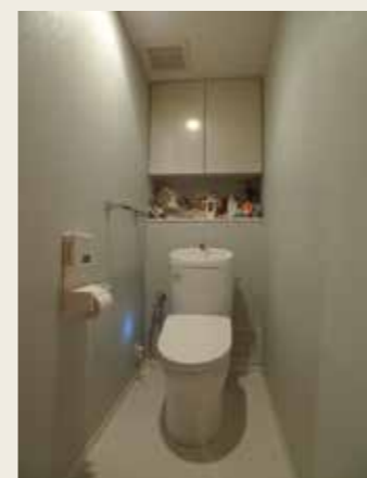
After: トイレの入れ替えがメイン