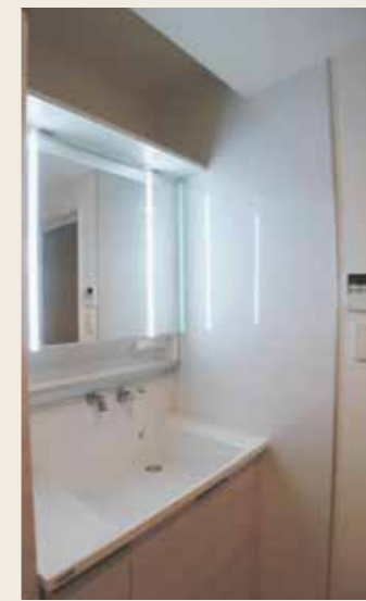
After: 側面壁はマグネット式壁面ボードを広く張っています。