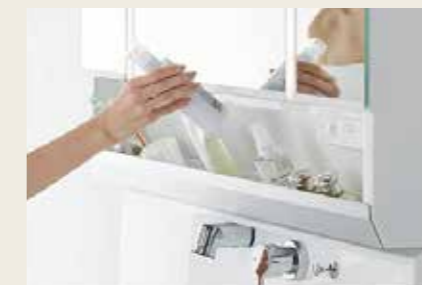
オープンで使いやすい鏡下収納