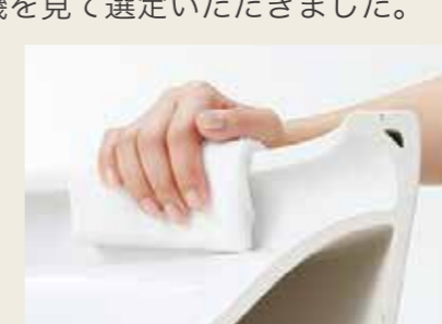
縁は汚れがつきにくく、拭きやすい