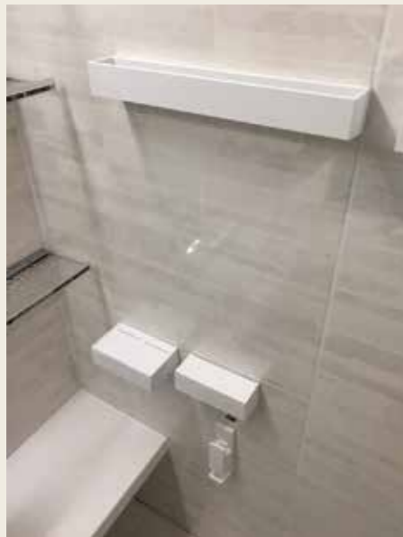
After: どこでも設置できるマグネット式小物収納