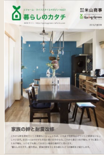
2016年7月・創刊号の表紙

事例 O1M 様もインタビューで仰っていた「話しやすい人がいい」。お客様自身が成功の秘訣をご存知でした。我々は相性がいいと言っただけのような関係を築けるように。もちろん嬉しいご意見もいただくこともあります。お客様の満足のために日々研鑽です。今後ともゴーイング・グリーンをよろしくお願い致します。