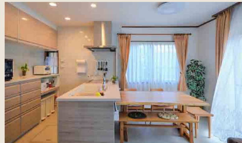
After：ダイニングキッチン