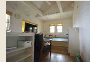
Before：ダイニングキッチン・小上がり