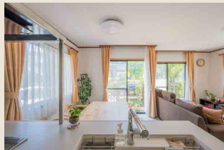
After：キッチンからダイニングを望む