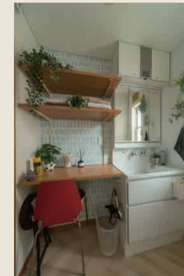
After：洗面とカウンター