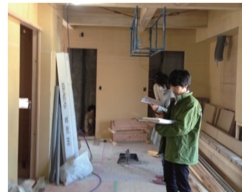
ゴーイング・グリーンのリフォーム現場