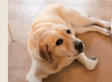
愛犬バルカちゃんも大満足？