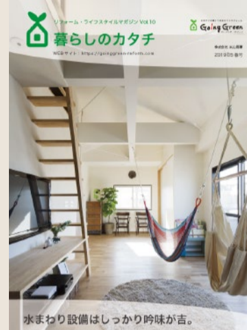
2019年5月・創刊10号の表紙