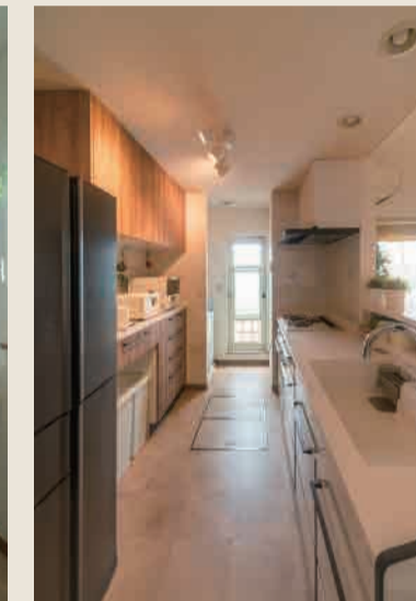
After：システムキッチン