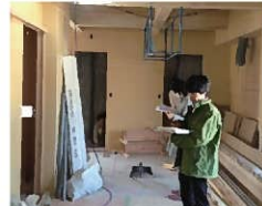
ゴーイング・グリーンのリフォーム現場