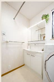
After：洗面化粧台交換、鏡、床張替え

2019年にトイレ工事のご相談をいただいてから、5年のお付き合い。その後、IH キッチンヒーターとレンジフードの交換、階段手すりの設置、コンパクトドレッサーの工事をご依頼いただきました。そして昨年の秋口には浴室と洗面化粧台のご相談がありました。年々浴室の寒さに耐えられなくなってきたため、その対策をしたいとのことでした。システムバス全体の断熱仕様と窓交換工事を提案しました。