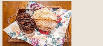
After：新しいキッチンでパン作り！

リフォームを段階的にすすめることにしっかりとのお考えをお持ちのH様。これからリフォームする方へとても参考になるご意見でした。ご協力ありがとうございました。