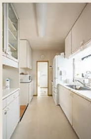
After：二重畳の目を揃えて床張り