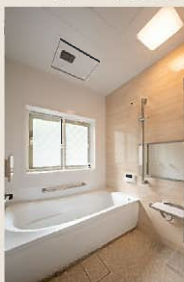
After：浴室。ブラインド窓を換装

浴室の断熱窓の打ち合わせの際、奥様から「今ついているブラインドはまた使えますか？」とのご質問がありました。新しい窓はひと回り小さくなるため、既存のものはお使いになれませんが、清掃のご不便を伺い、せっかく新調されるのであればと、ブラインド内蔵のサッシをご提案しました。また、過去のリフォームで使用した床材を探し出し、隣り合うキッチン・洗面所に同じ床材を貼りました。リフォーム時期は違っても継ぎ接ぎ感がなく、一連の繋がった空間として見えるように配慮しました。永くご愛顧いただけるからこそ、今後も奥様やご家族の細かなニーズに気づき、ご提案していきたいと考えています。