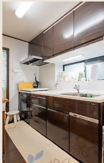
After：キッチンリフォーム

中古戸建てをご購入され、水回りを始め必要とするリフォームに目星を付けて、順次予算やタイミングに合わせて4年にわたり、リフォームを繰り返し行って頂いています。